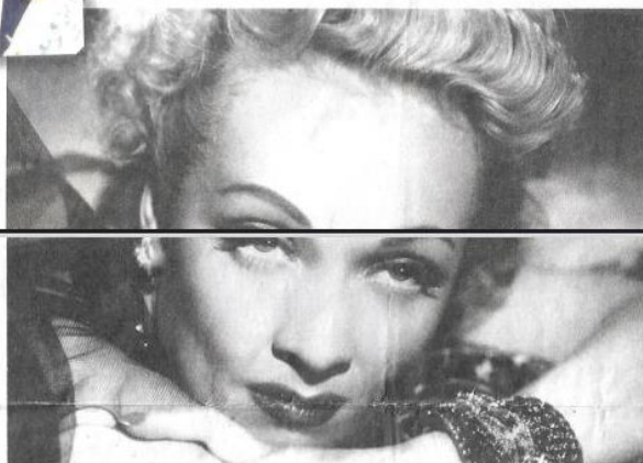
■ Mariène Dietrich.