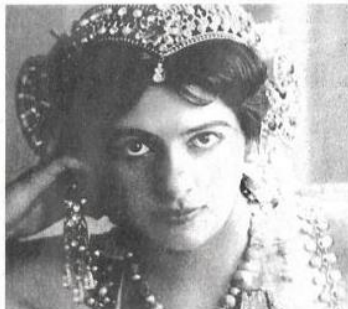
■ Mata Hari.

mijn spontaneiteit, mijn grote mond, maar ook van mijn discretie. Ik speelde."