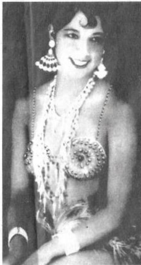
■ Joséphine Baker.

Overtuiging dreef ook de Britse verpleegster Edith Cavell om gewonde soldaten tijdens de Eerste Wereldoorlog te verzorgen en