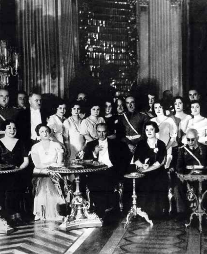
Latife Hanım (midden, in het zwart gekleed) als mondaine gastvrouw.

24 jaar was Latife toen ze in 1923 trouwde. Mustafa Kemal Atatürk was er 41. De meeste vrouwen spraken hun echtgenoot toen aan met 'mijn meester' of met 'mijn papa'. Latife keek Atatürk recht in de ogen en zei gewoon 'Kemal'. Mondig was de pittige first lady van Turkije zeker. Geboren op 17 juli 1898 in een rijke familie als oudste van zes overlevende kinderen (van tien) zorgde haar vader voor een uitstekende opvoeding, dezelfde als haar jongere broertjes kregen. Misschien lag daar al de grondslag voor haar latere assertiviteit. Ze had een Britse nanny en vanaf haar drie jaar kreeg ze Latijnse les