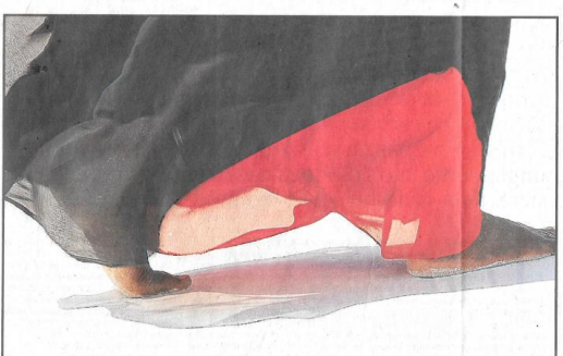
■ 'We dragen allemaal littekens en desondanks hebben we de kracht om verder te gaan.'

De foto's van Angèle Etoundi Essamba zijn ingelast in de tentoonstelling Persona, tot 3 januari 2019 in het Museum Huiden-Afrika in Brussel, www.africanmuseum.be. Nieuwste boek Voiles et Dévoilements verschijnt online bij Editions Cheminements, www.cheminements.be, www.essamba-art.com