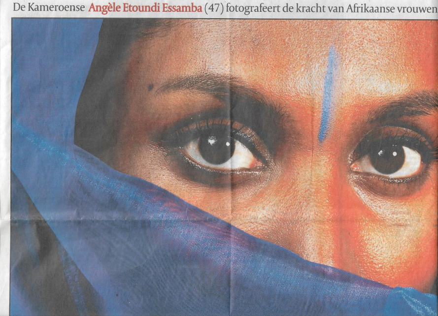
■ 'Alles passeert via de blik. Het is die ziel die ik fotografeer. Er zitten vaak zoveel boodschappen in die ogen, ook al lezen we nooit hetzelfde bericht.'