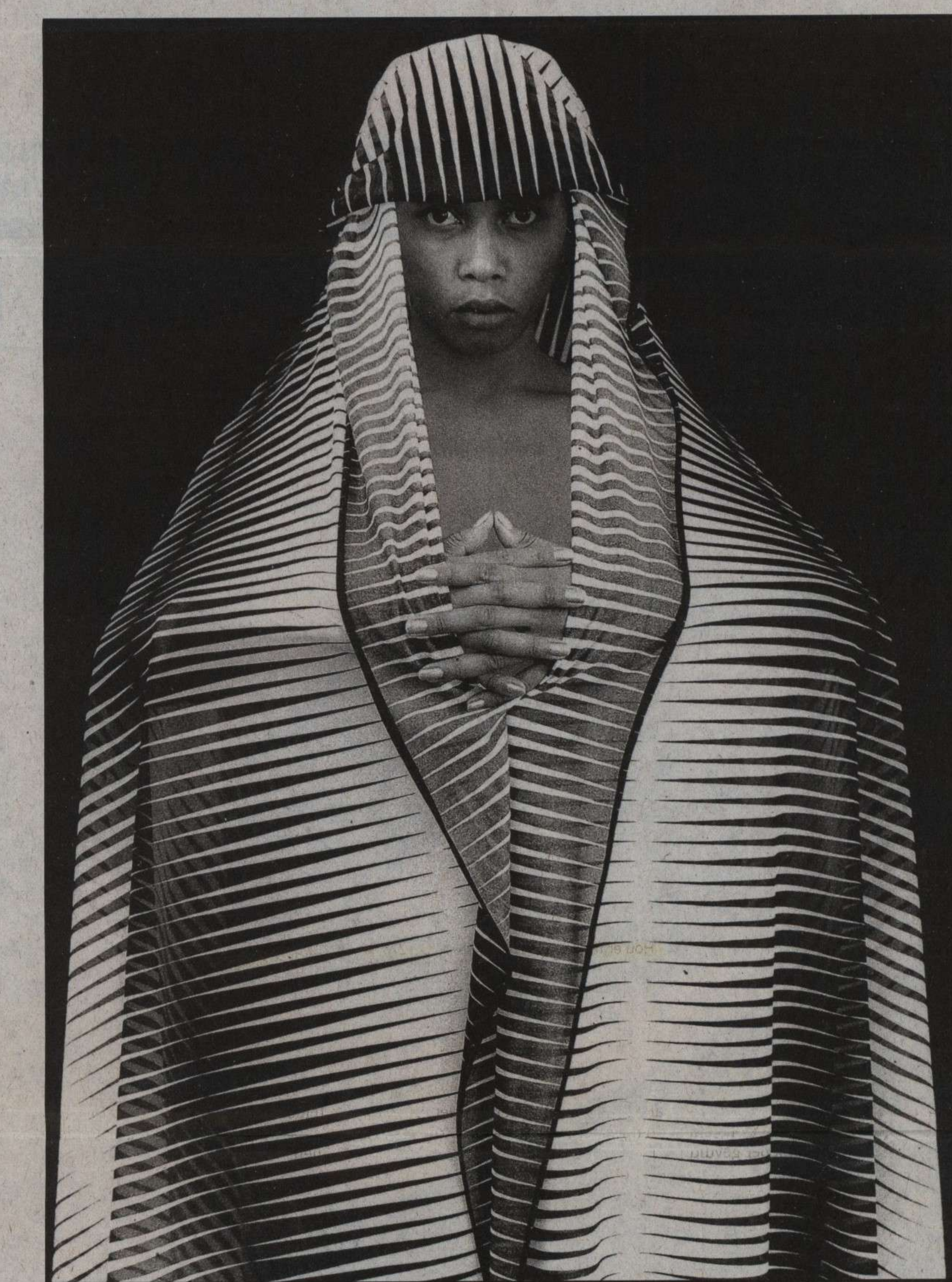
■ 'Die verfijnde draagwijze van een sluier is eigenlijk een verdoken oproep om bekeken te worden.'

Voor haar nieuwste boek Voiles et Dévoilements werkte ze in Zanzibar. Zanzibar was in 1999 de Pan-Afrikaanse Conferentie van vrouwen de verkering van 'Nous, femmes d'Afrique' lanceerde voor het bevorderen van de vrede. Met dit boek, dat ze haar vierde baby noemt, poneert ze haar sensuele beelden in de heersende discussie over de sluier. 'De sluier ontsluit' is misschien nog wel de beste vertaling. "Mijn beelden willen breken met voorgerekende ideeën. De vrouw,