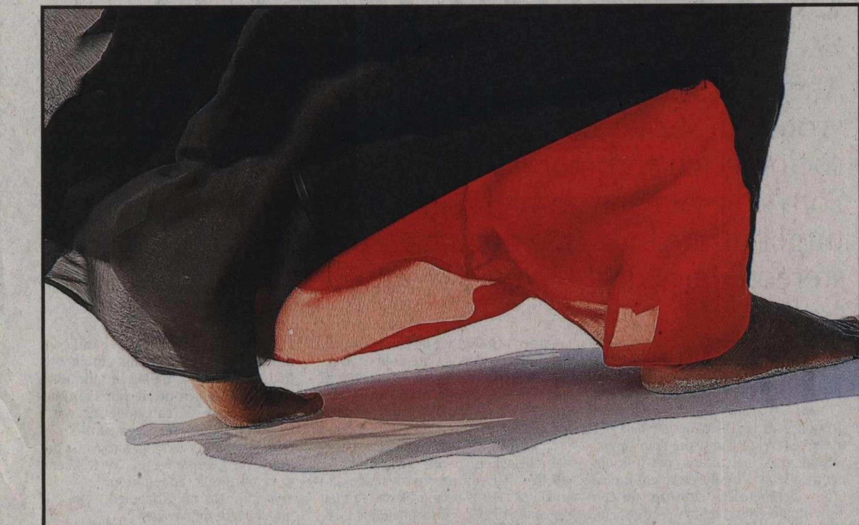
■ 'We dragen allemaal littekens en desondanks hebben we de kracht om verder te gaan.'

De foto's van Angèle Etoundi Essamba zijn ingebed in de tentoonstelling Persona , tot 3 januari 2010 in het Museum Midden-Afrika in Tervuren, www.africamuseum.be/persona . Het boek Voiles et Dévoilements verschiet onlangs bij Éditions Cheminements, www.cheminements.fr , www.essamba-art.com .