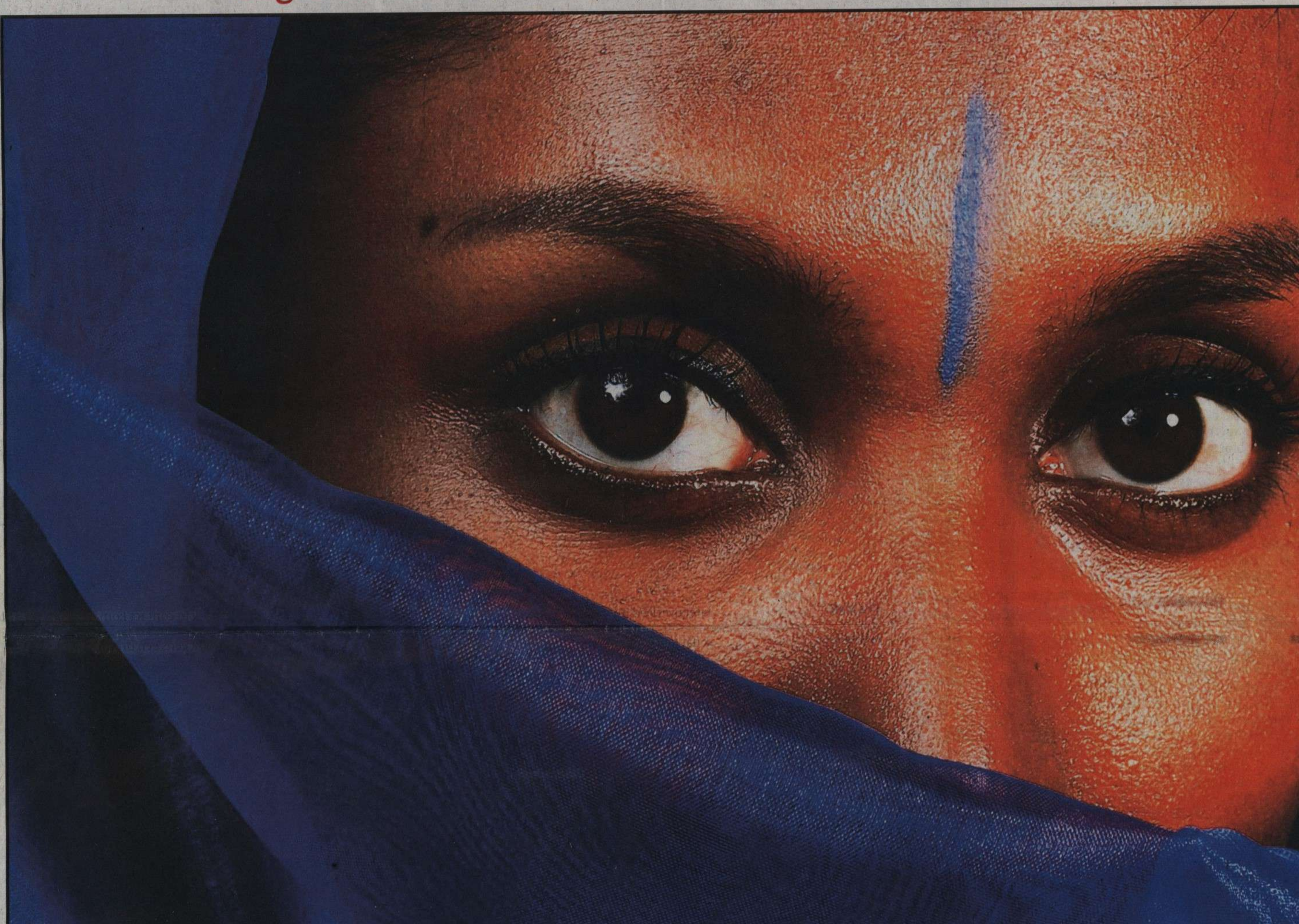
■ 'Alles passeert via de blik. Het is die ziel die ik fotografeer. Er zitten vaak zoveel boodschappen in die ogen, ook al lezen we nooit hetzelfde bericht.'

De Kameroense Angèle Etoundi Essamba (47) fotografeert de kracht van Afrikaanse vrouwen